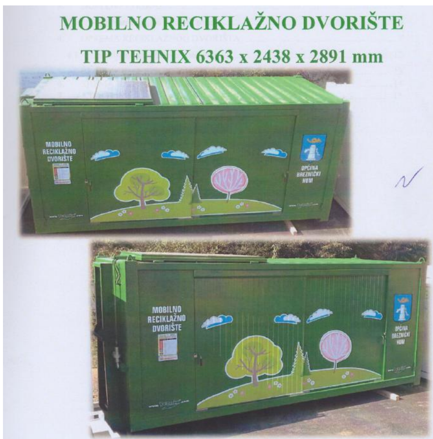
Slika 2. Mobilno reciklažno dvorište

Općina je dužna osigurati pristupačno korištenje reciklažnog dvorišta svim stanovnicima područja za koje je reciklažno dvorište uspostavljeno.