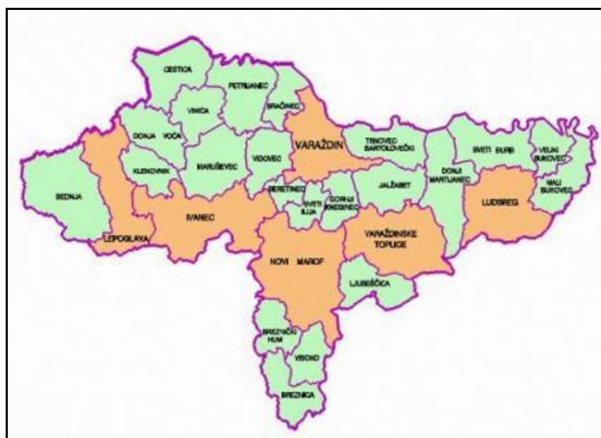
Slika 1. Smještaj općine Breznički Hum u Varaždinskoj županiji

Prema popisu stanovništva 2011. godine broj stanovnika iznosi 1.356.